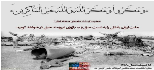
۵ دیهشت سال ۱۳۵۸ شهرزاد شکست خنده نعلی آمریکا در پس گرمی باد ملیت ایران باطل را به دست حق و به بازوی نیرومند حق در خواهد کوبید. حضرت آیت‌الله خمینی مدظله العالی